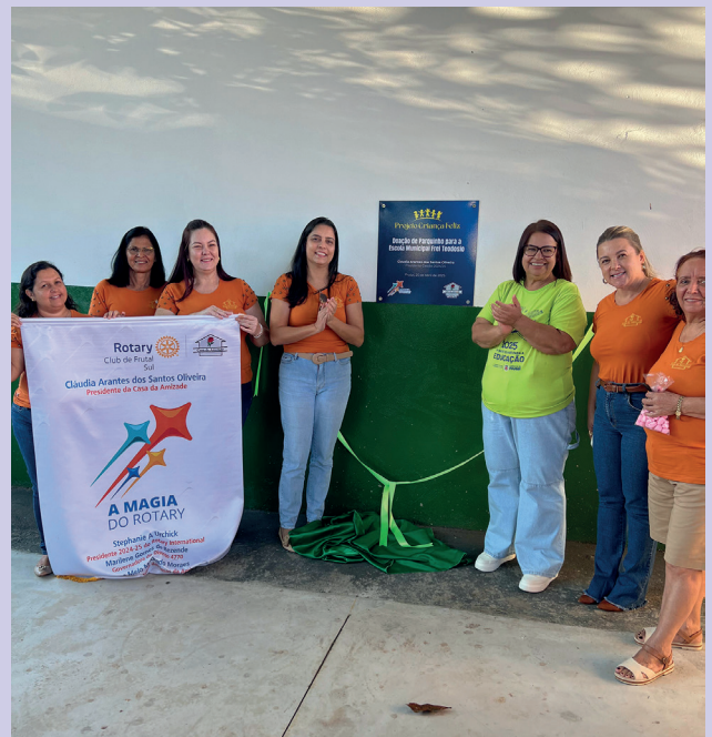
Casa da Amizade de Frutal: projeto entregou parquinho para escola municipal