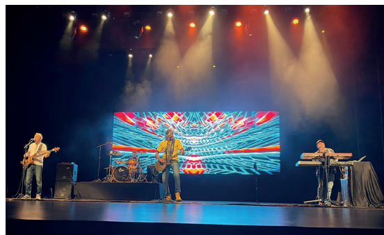
Show beneficente do 14 Bis no Sesc Palladium, onde tudo começou

As soluções estavam chegando gradualmente. Agora os dois clubes mineiros tinham o desafio de adaptar o veículo para comportar um consultório e três cabines de vacinação. A Cerne Construções aceitou realizar esse trabalho, cobrando R$ 35 mil pelo material e pela mão de obra. Outros R$ 10 mil foram investidos em plotagem, feita pela empresa Personalizze. Equipamentos e móveis consumiram o restante dos recursos.