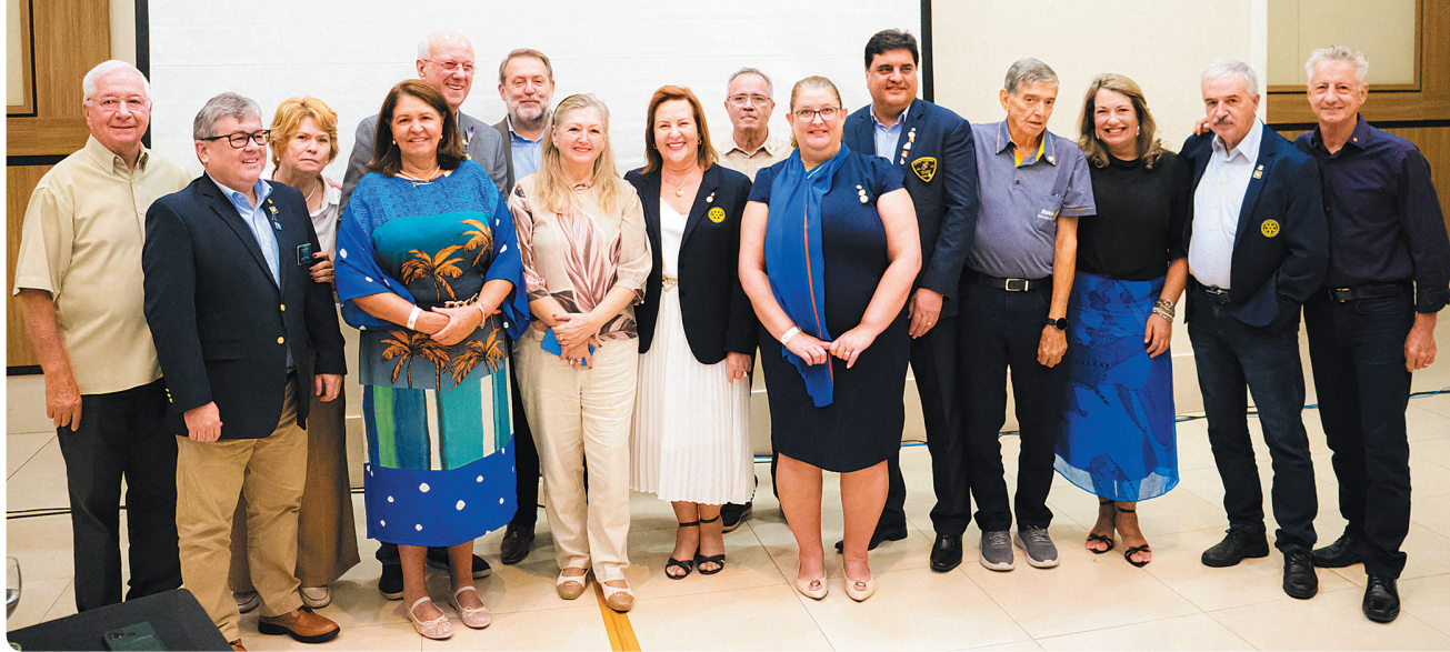
Lideranças reunidas em Foz do Iguaçu para pensar o quadro associativo do Rotary na América Latina