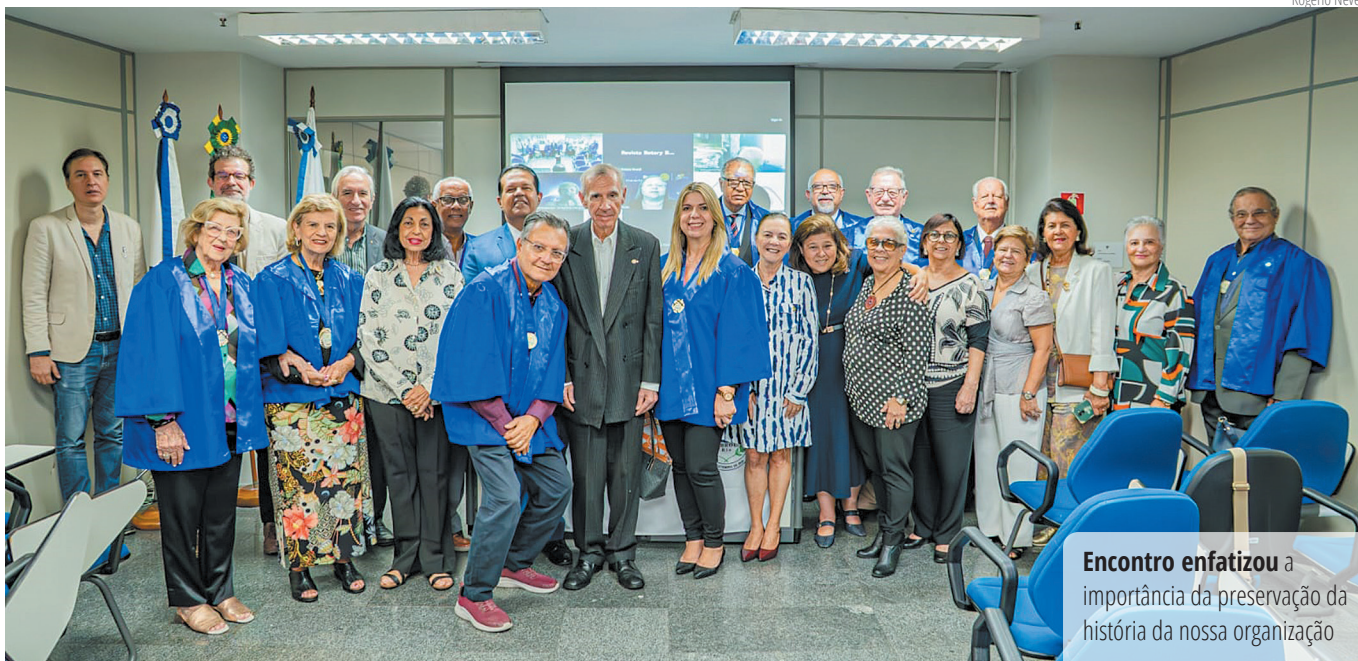
Encontro enfatizou a importância da preservação da história da nossa organização