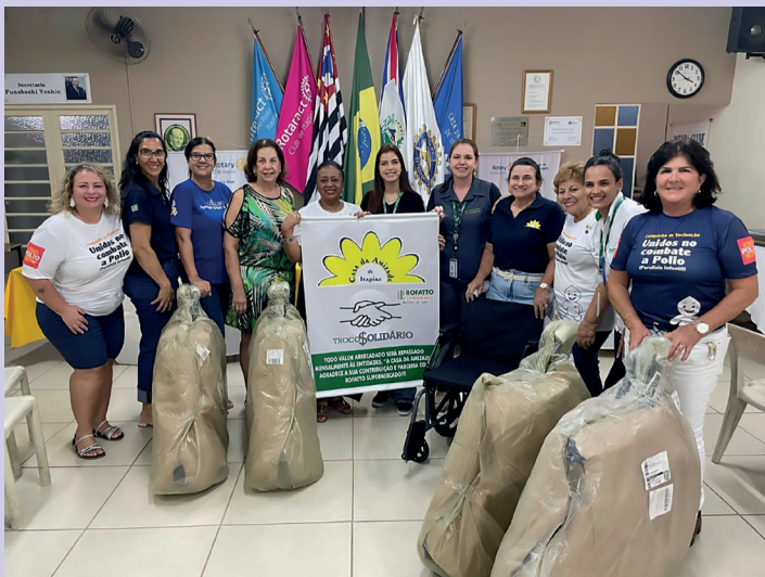
Casa da Amizade de Itapira: campanha adquiriu cinco cadeiras de rodas