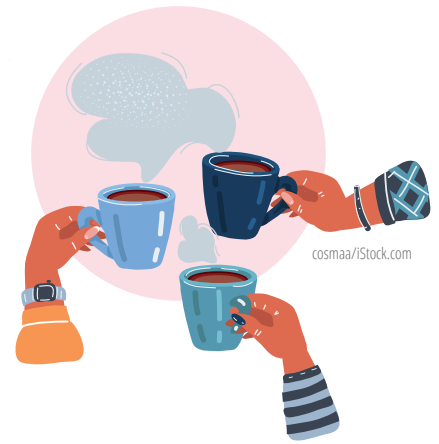
Arte: Armando Santos